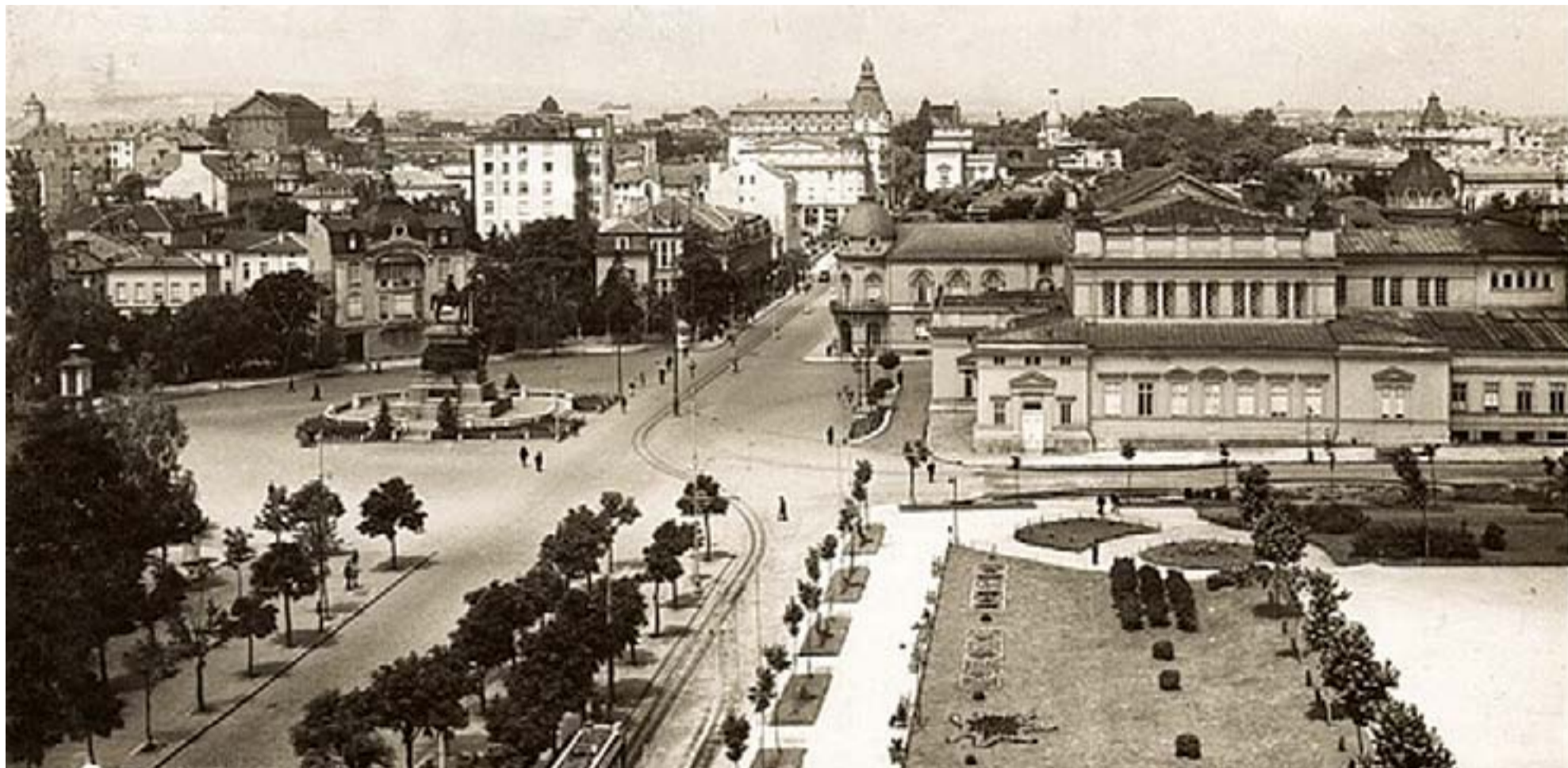
София, пл. Народно събрание