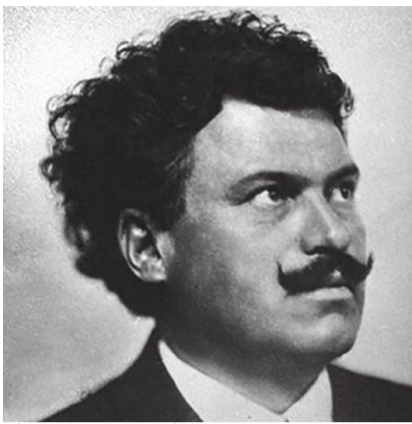
(Александър Стамболийски - роден на 1 март 1879 година в село Славовица, убит на 14 юни 1923 г.)