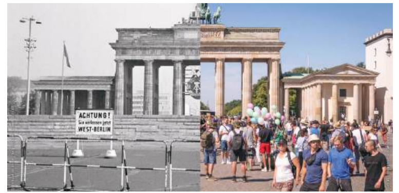
Германия преди Обединението и сега

След тази нощ вече нямаше връщане назад. Първата дупка в Стената нанесе съкрушителен удар на болната система. На 9 ноември в Германия за трети път се пишеше история. Този път щастлива. Дори и многото трудности, последвали падането на Стената и обединението на Германия, не могат да променят това. Защото постигането на единство вътре в обществото изисква повече време, отколкото националното обединение.