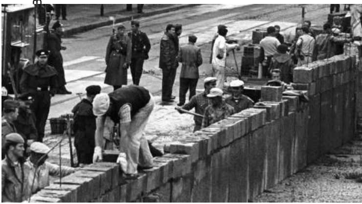
През 1961 издигат Берлинската стена