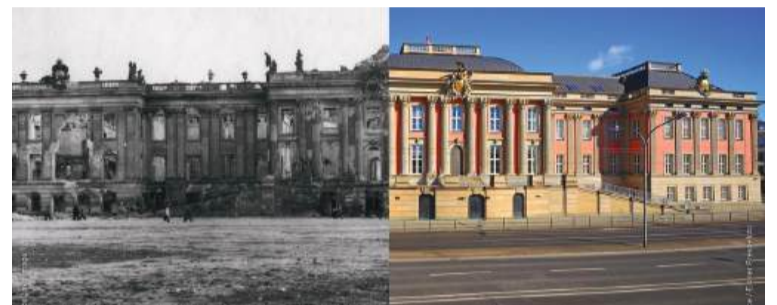
Градският замък в Потсдам