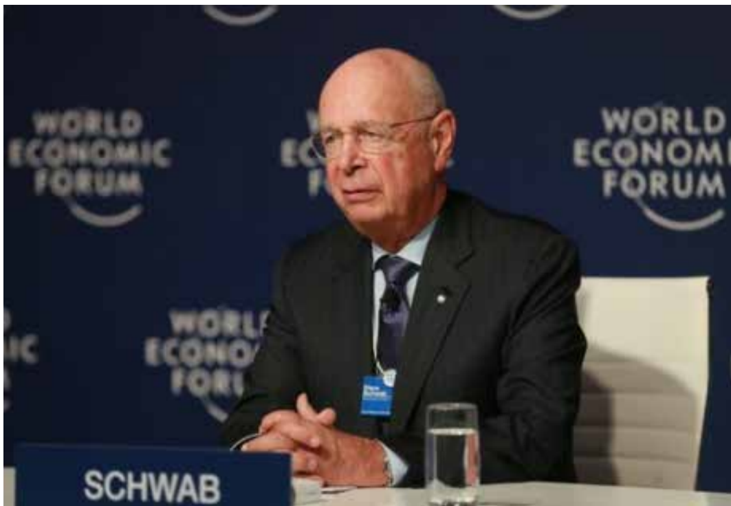
Клаус Шваб, създател и ръководител на икономическия форум в Давос