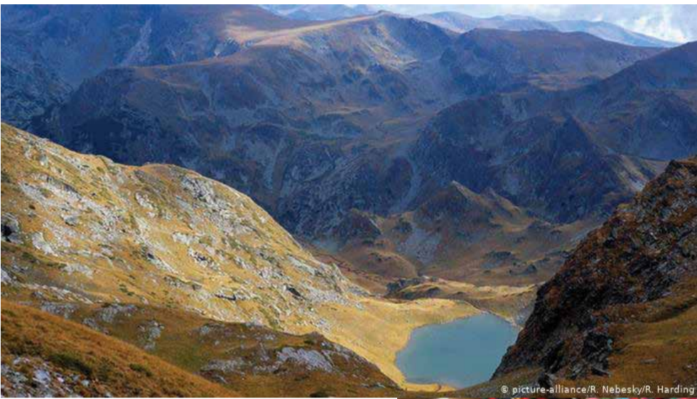
"Паницата" в Рила