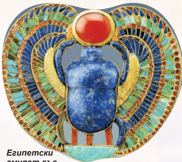
Египетски амулет със скарабей

усвояемост. Но те могат да бъдат само в течен вид и под формата на много дребни частици. За сравнение, те са 7000 пъти по-малки от червеното кръвно телце - еритроцита. Затова често се комбинират с други лекарствени