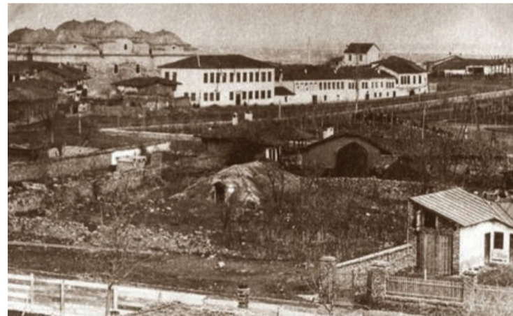
Мястото около Градската градина по онова време

„Народното събрание се събираше в барака-та, в която амбулантната трупа на Георги Попова даваше представлението си. По едно странно съвпадение, величественото здание на днешния Народен театър се гради на същото място, дето беше тая барака! Мястото, дето днес горделиво се красува зданието на Народното събрание, тогава беше купище извън града. Няколко цигански колиби бяха разпънати там“. Това свидетелства не кой да е, а патриархът на българската литература Иван Вазов в своите мемоари. Той попада в София малко след като градът става столица на освободената ни родина.