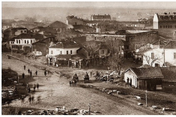
Кръстовището между улиците „Търговска“ и „Дондуков“, след като вече те се появяват на картата на стара София