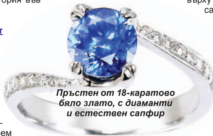
Пръстен от 18-каратово бяло злато, с диаманти и естествен сапфир

решителността, привлича приятели, носи душевен комфорт, охлажда излишните страсти, в това число и любовни. Като амулет, отблъсква враговете и завистниците, предпазва от вероломство, меланхолия, страх, сърдечни заболявания и отравяния. Засилва чувството за милосърдие и увеличава способност-