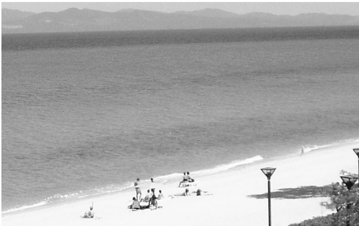
Водата е течен кристал. Морето е огромен течен кристал, който облъчва хората край него и повишава интелигентността им

Чрез енергизатор (елементарна частица, поток или лъч от енергия) отвън, то може да приеме информация от Космоса . Медитацията насочва този лъч към епифизата и Силициевия кристал, при което в съзнанието му изникват образите на коди-